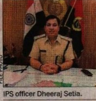
IPS officer Dheeraj Setia.

A local court today ordered the polygraph test of suspended IPS officer Dheeraj Setia in Gujarat.